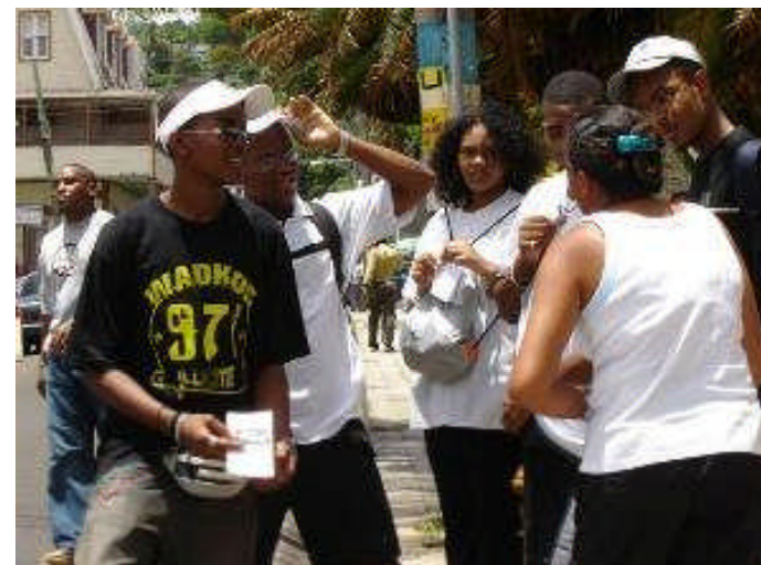
Photo: 1ère Conférence de la Jeunesse Immigrée en Suisse, NE 08 www.cads.ch

« Ensemble pour une intégration réussie »